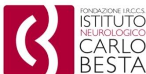
Foundation Neurological Institute Besta, Italien