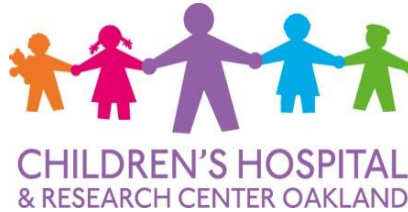
Children's Hospital Oakland, USA